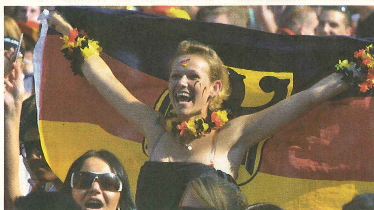
Weibliche Fußballfans: Der WM-Ratgeber für Frauen, den jetzt eine Studentengruppe vermarktet hat, enthält auch Tipps fürs Outfit.

„Wir konnten so ohne großes Risiko unternehmerische Erfahrung sammeln“, sagt Wawra. Außer ihr setzten noch zwei weitere Teams auf die WM-Begeisterung. Ihre Ideen: Deutschlandflaggen fürs Fahrrad und das Nach-Hause-Liefern von Bier .... MST